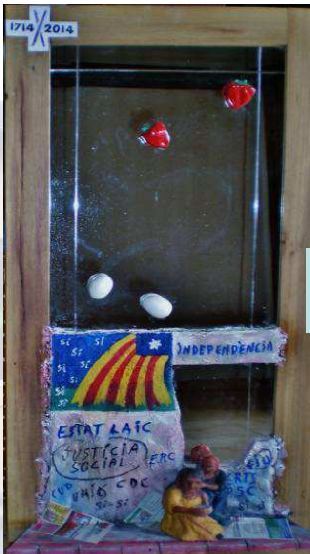
Jugant amb la plàstica de TON QUATRE