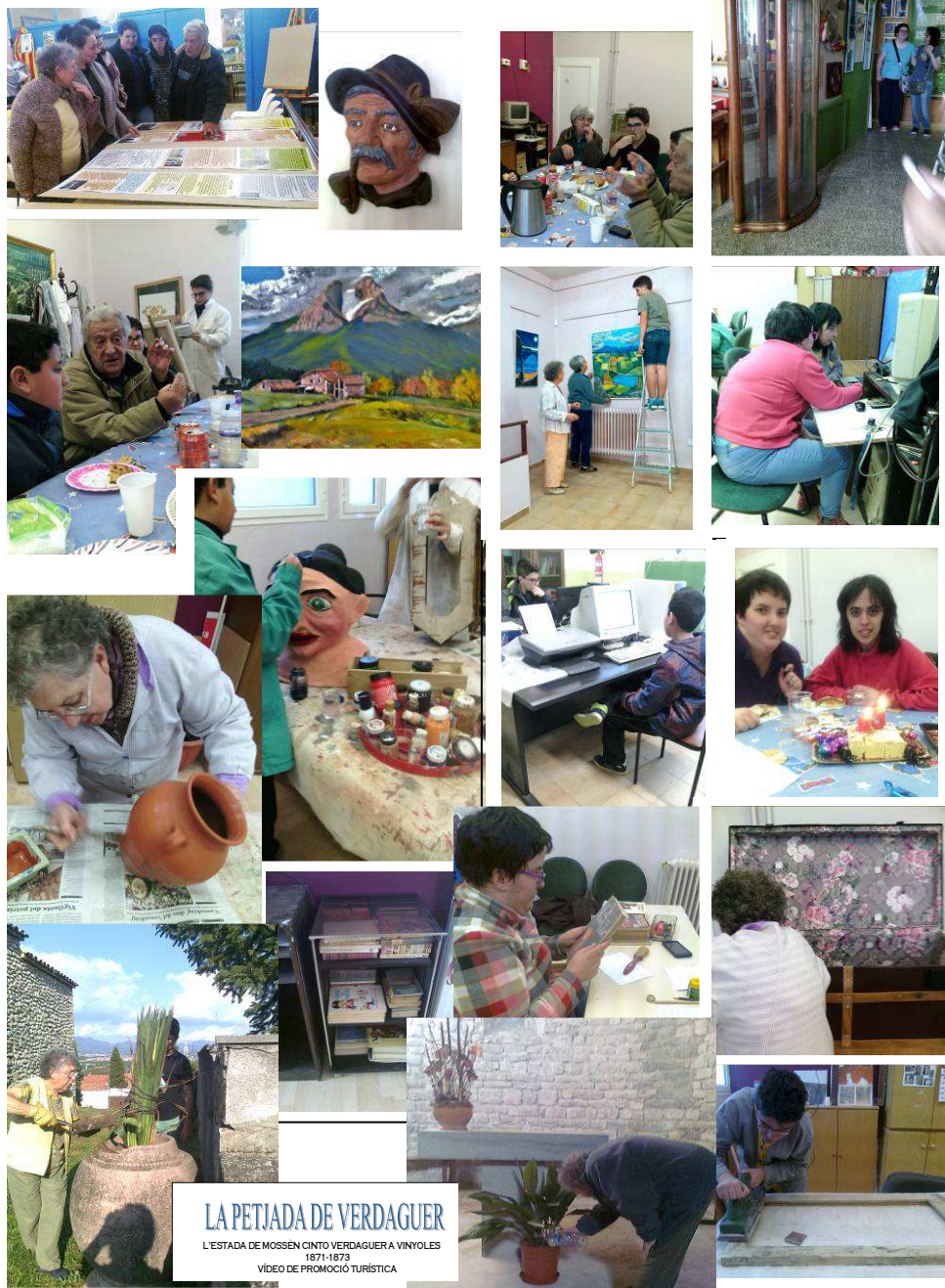
LA PETJADA DE VERDAGUER L'ESTADA DE MOSSÈN CINTO VERDAGUER A VINYOLES 1871-1873 VIDEO DE PROMOCIÓ TURÍSTICA

Què s'ha fet aquest curs passat? (una mica)